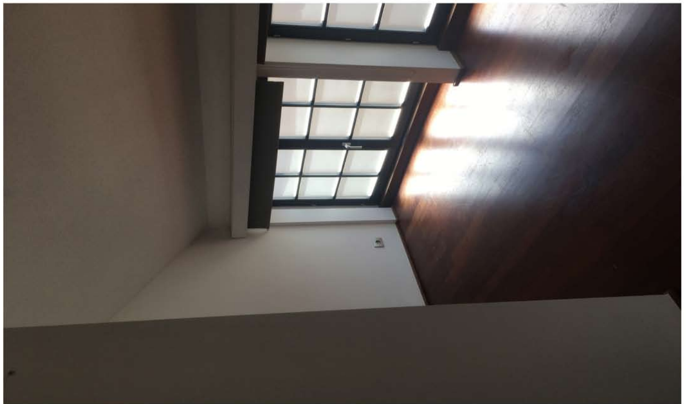
PHOTO 9 ( vue intérieure façade avant 2e étage (chambre) - zone de modification façade