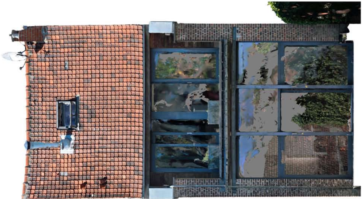
PHOTO 7 - orthophoto façade arrière