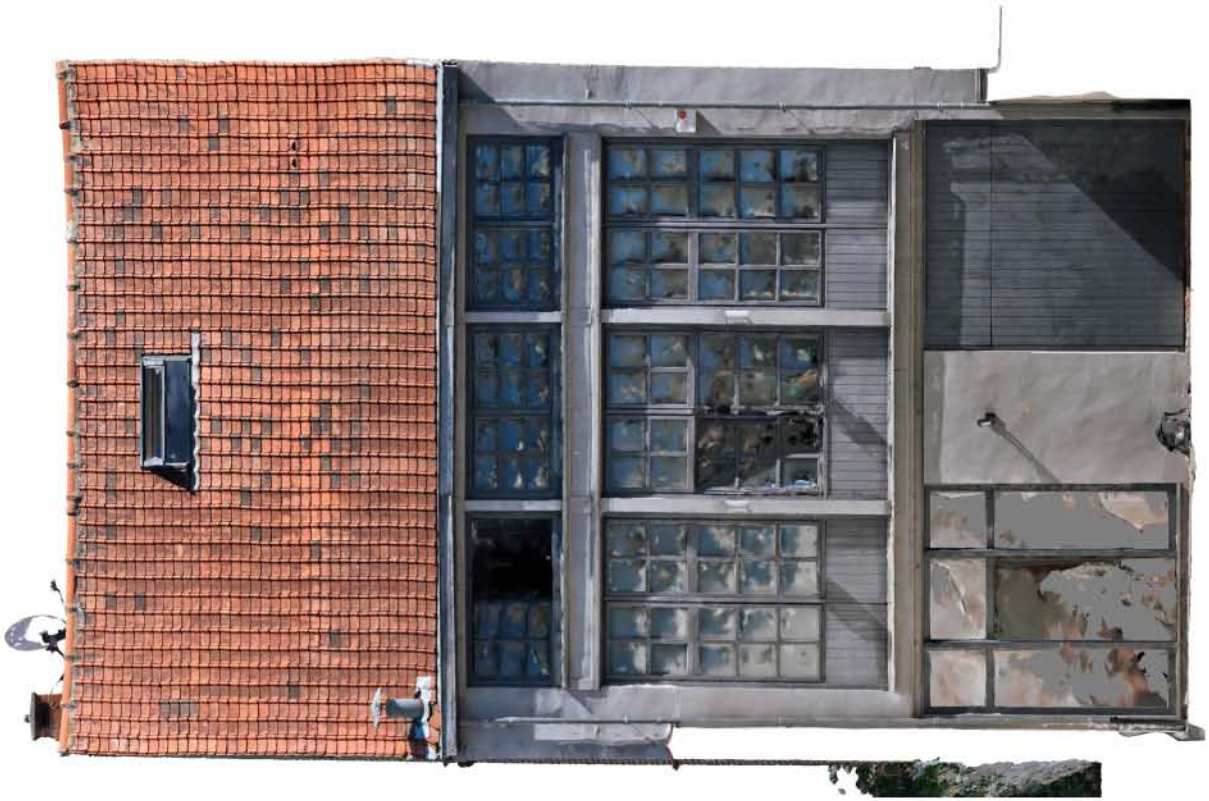
PHOTO 6 - orthophoto façade avant