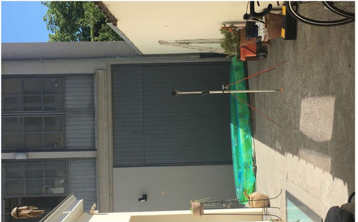
PHOTO 5 - cour intérieure