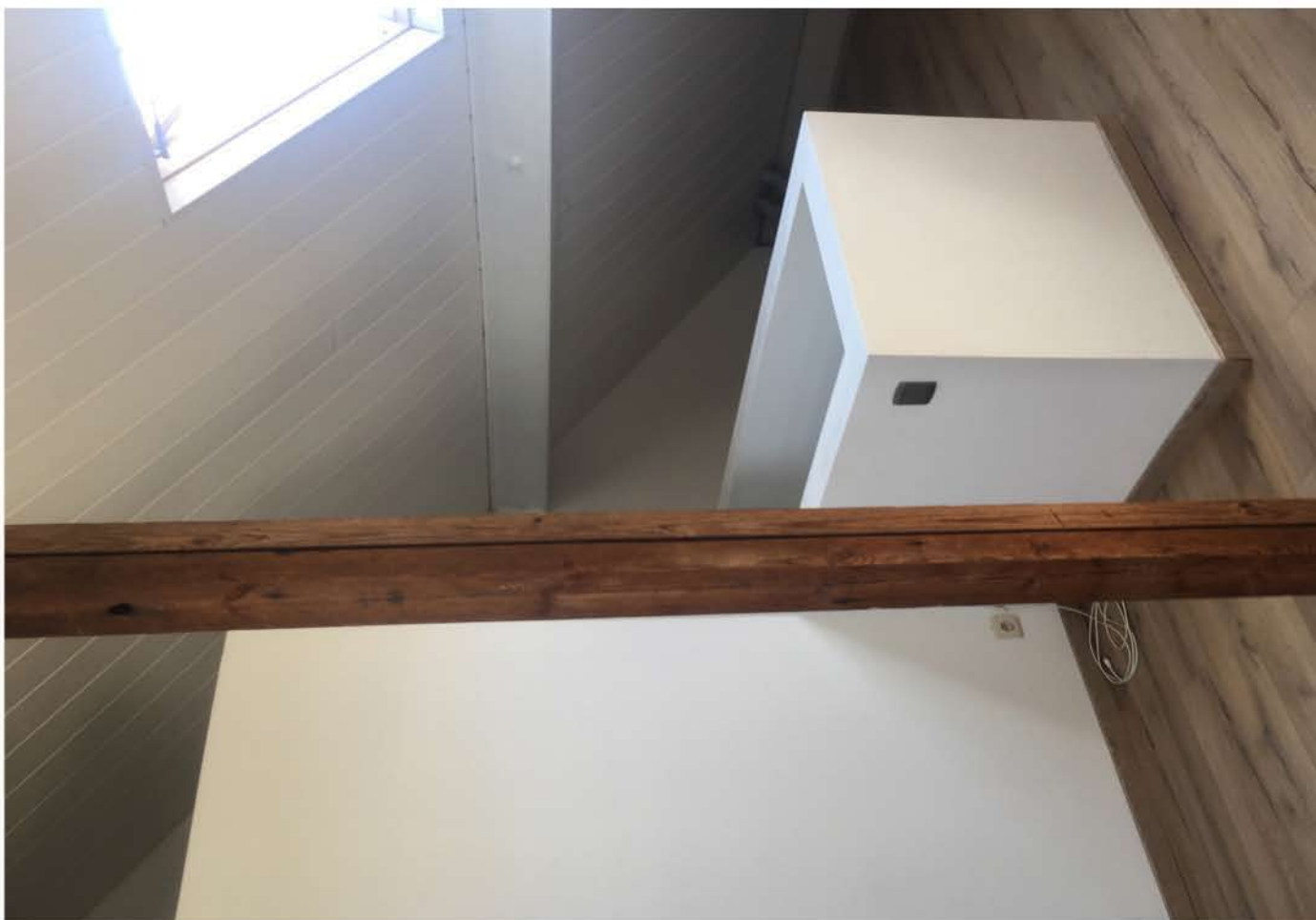
PHOTO 10 - 3e étage - zone de création de lucarne