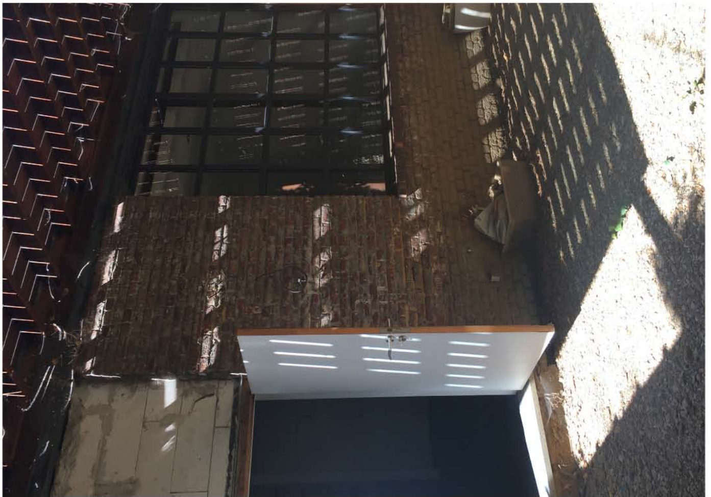
PHOTO 8 - façade arrière RDC (jardin) - zone de modification façade