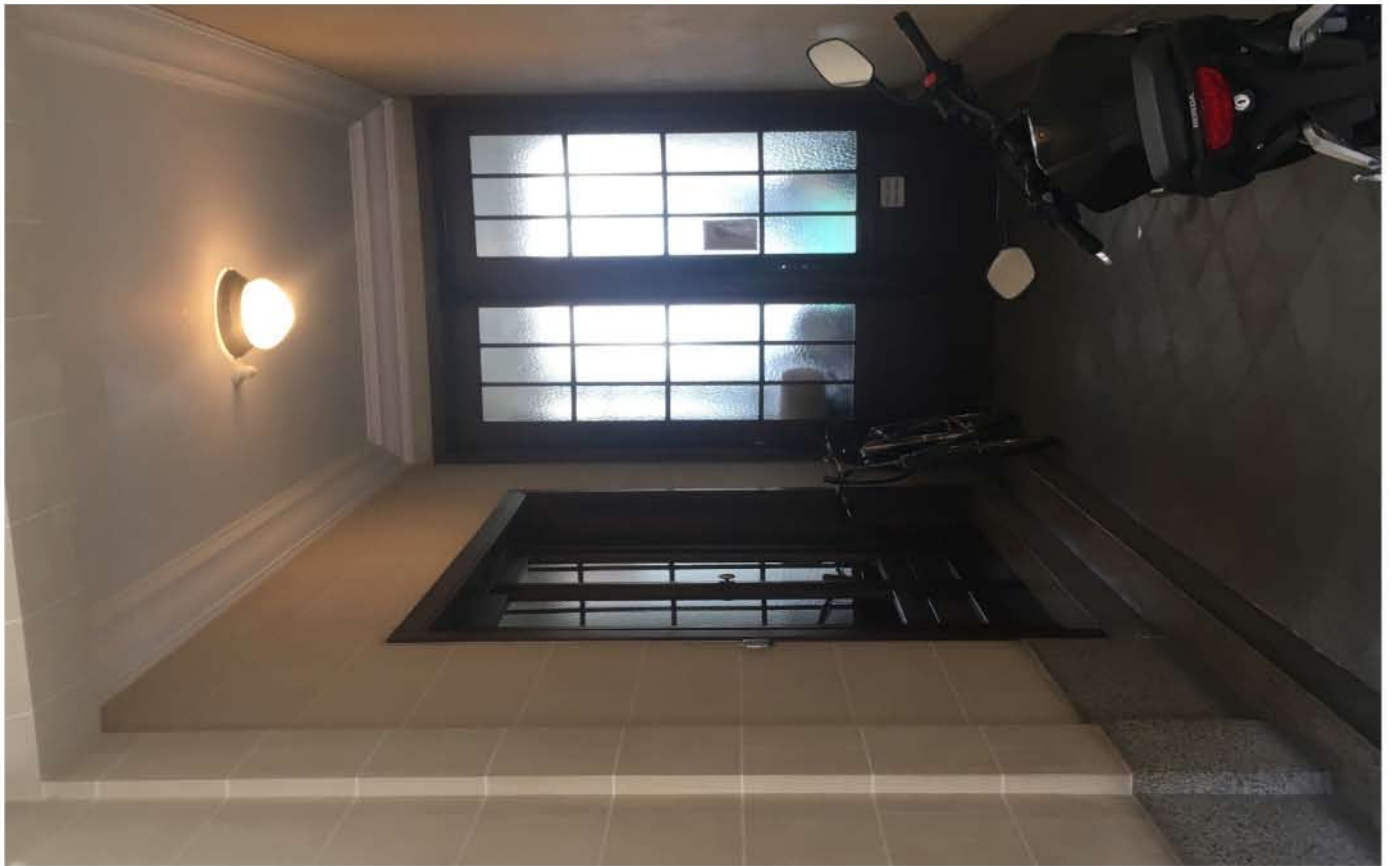
PHOTO 4 - hall cocher